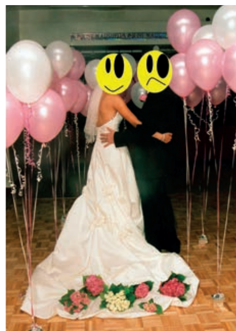
Fairytale for Sale 2011-2013